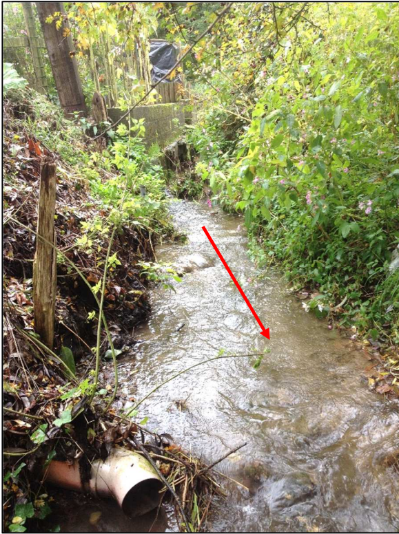
De Noorbeek stroomopwaarts de monding in de Voer