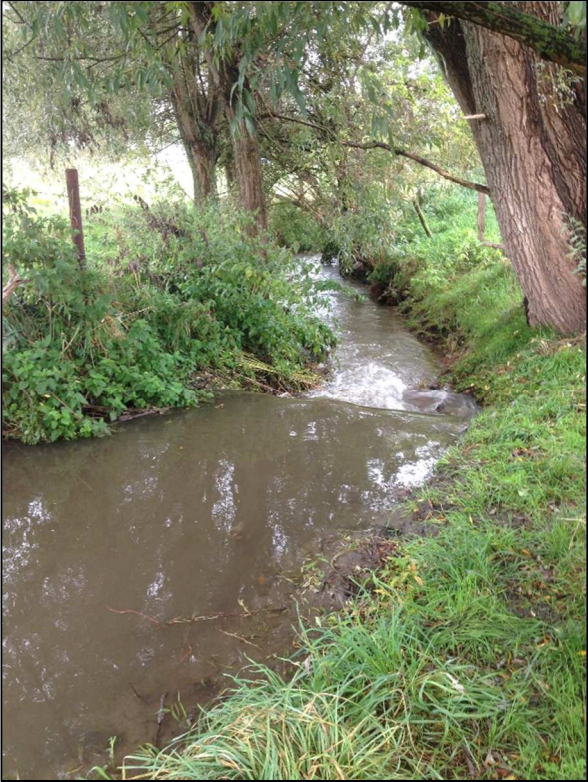
Typische bodemval in de Voer →